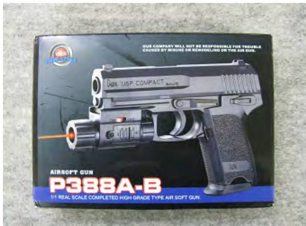
AIRSOFT GUN P388A-B