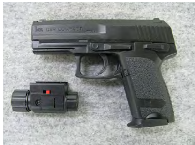
P37 POWERFUL LASER POINTER